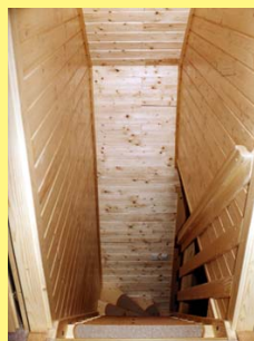
Bajada de la escalera desde la planta piso, al recibidor en la planta baja casa.